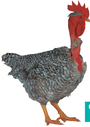
Gris Barré Cou Nu

Le reproducteur : Gris barré cou nu Plumage gris barré. Pattes, bec et peau jaunes. The male breeder: Grey barred naked neck. Grey barred feathers. Yellow shanks, beak and skin.