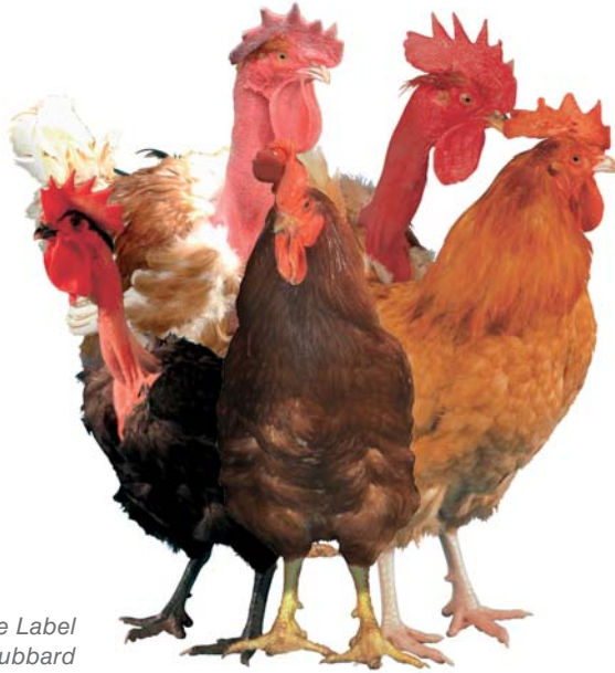
La linea maschile Label Rouge di Hubbard

Negli ultimi anni il mercato del Label Rouge ha mostrato un forte incremento in percentuale nella produzione di pollo in parti. Le tecniche di selezione attuali, utilizzando strumenti di alta tecnologia, consentono ai produttori Label Rouge di rispondere al meglio alle nuove sfide del