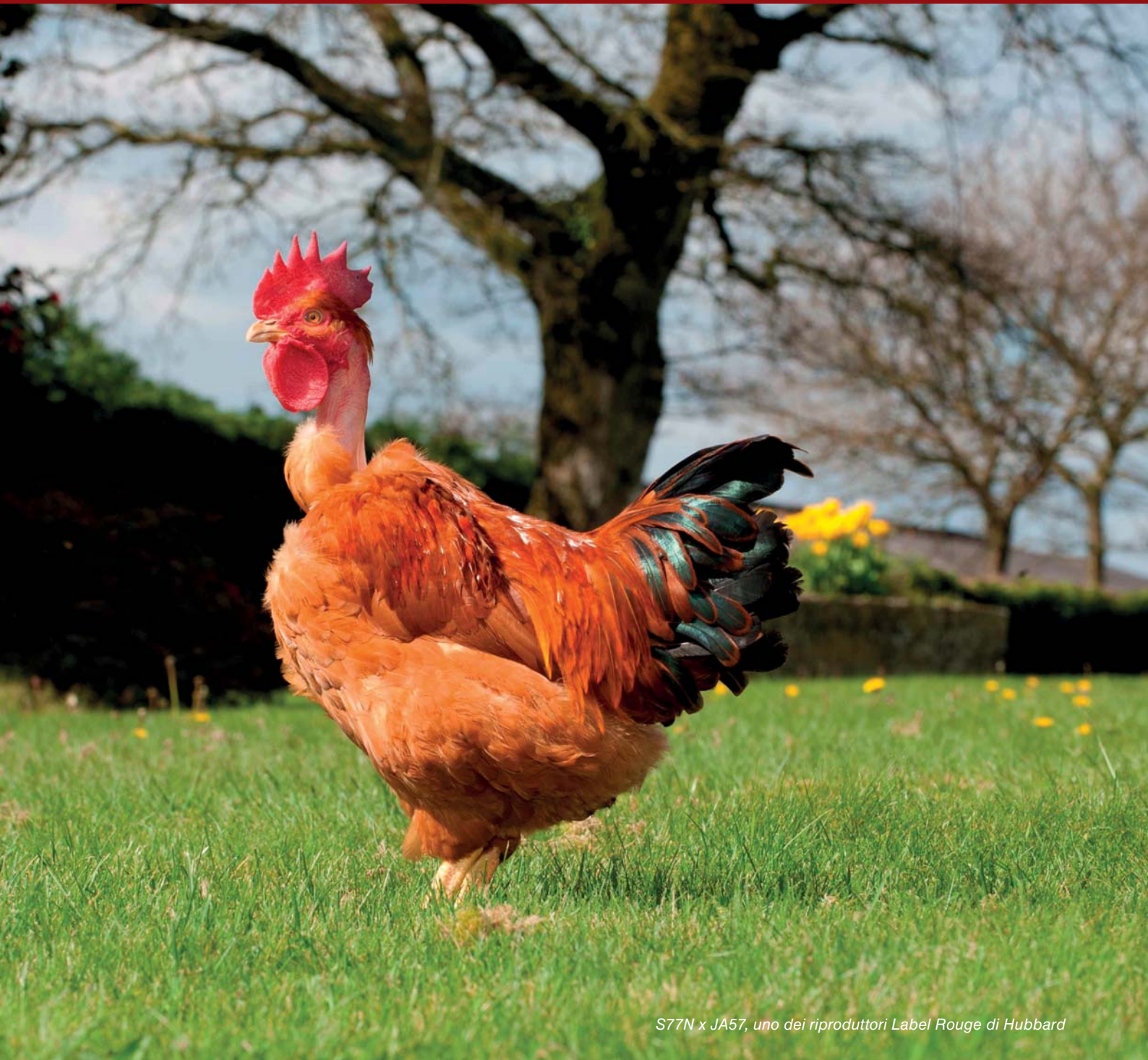
S77N x JA57, uno dei riproduttori Label Rouge di Hubbard