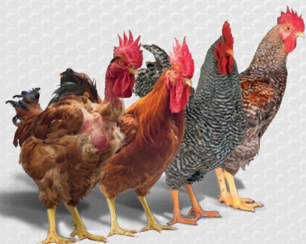
Mâles à croissance intermédiaire

GMQ : 38-45 g/j Plumage : Brun et irisé blanc Utilisation : Élevages extensifs en bâtiment, Plein Air et «Certifiés»